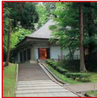
จวนจิคินจิคิโดชินโอบโด