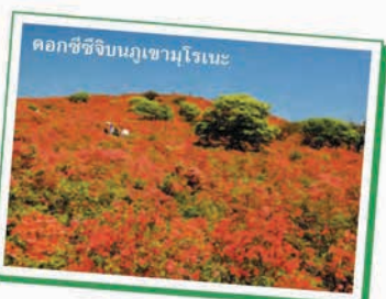
ดอกชิชิจิบนภูเขาโมโรเนะ

แม่น้ำคิตะคามิและภูเขาทาบาชิมะยามะ อิชิโนะเซกิ ด้วยหุบเขาเก็บกินเคอิที่อยู่ทางทิศตะวันตกและช่องเขาเก็บกินเคอิที่อยู่ทางทิศตะวันออกของเมือง อิชิโนะเซกิจึงเป็นดินแดนกว้างใหญ่ที่เต็มไปด้วยธรรมชาติอันสวยงาม เมื่อฤดูใบไม้ร่วงมาเยือน หุบเขาทั้งสองแห่งนี้จะดูแดงแฉ่งแฉ่งสีส้มจนงดงามด้วยใบไม้เปลี่ยนสี ทิวทัศน์ของภูเขาโมโรเนะนั้นสวยงามแตกต่างกันไปในแต่ละฤดูกาล ในช่วงต้นฤดูร้อน ที่นี้จะถูกย้อมไปด้วยสีชมพูของดอกชิชิจิหรือดอกกุหลาบพันปี