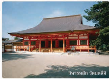
วิหารหลัก วัดมตสึจิ