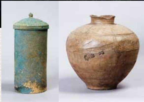
在金鸡山山顶附近发掘出的装有经典的铜制容器与收纳这种容器的用的陶器壶。

奥州藤原氏在建造寺院和官厅时，将金鸡山作为基准点。并在山顶上建造了埋藏经典的冢（经冢）。金鸡山是象征平泉的信仰之山，是一处作为城镇建设基准点的重要遗迹。